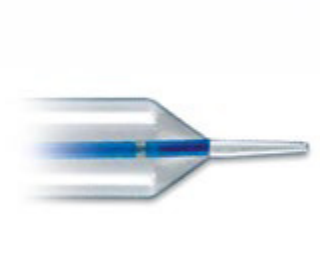
Extremo de forma cónica